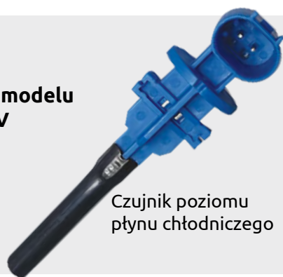
Czujnik poziomu płynu chłodniczego

W zależności od modelu zbiorniczka SKV w opakowaniu można znaleźć: