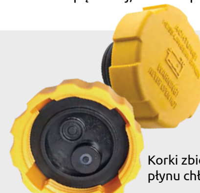
Korki zbiornika płynu chłodniczego

Czujniki poziomu oraz korki płynu chłodniczego dostępne są w kategorii "Chłodzenie" na www.skv.pl