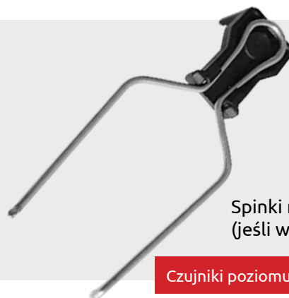
Spinki montażowe (jeśli występują)