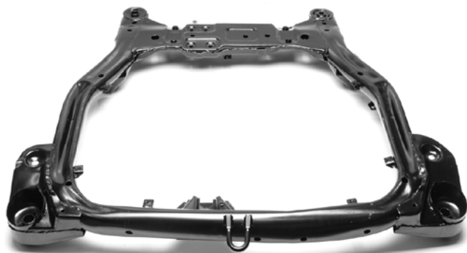
645KV029 HYUNDAI • KIA

Sanki marki SKV zawieszenia pełnią dodatkową funkcję, która ma kluczowe znaczenie w przypadku zderzenia samochodu. Stanowią one istotną część kontrolowanej strefy zgniotu . W trakcie wypadku absorbują część siły uderzenia i stanowią ważny element ochrony zarówno kierowcy , jak i pasażerów, zmniejszając ryzyko wystąpienia poważnych obrażeń.